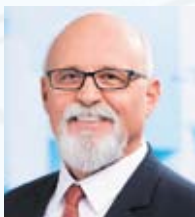
Riz Gábor (Fidesz)