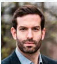
Fekete-Győr András (Momentum)