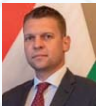
Tamás Menczer (Fidesz) vice-président