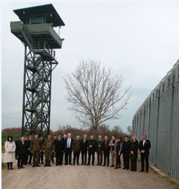
Visite des délégations de la Commission des affaires européennes de l'Assemblée nationale hongroise et de la Sous-commission permanente des affaires européennes du Conseil national du Parlement autrichien à la frontière terrestre gréco-turque, Evros, mars 2024