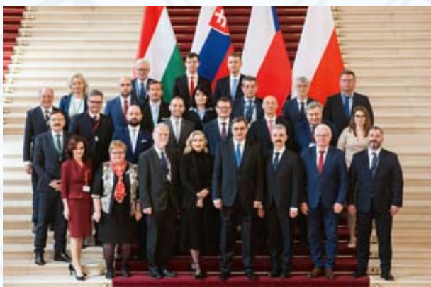
Participants à la réunion des Commissions des affaires européennes des pays Visegrád, Budapest, avril 2023