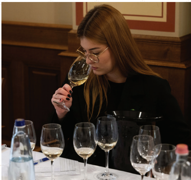
A bírálóbizottságok tagjai: