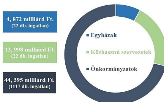
1. ábra: A 2008 és 2016 között ingyenesen átruházott állami ingatlanok összértéke és kedvezményezetttek szerinti megoszlása

Az Alaptörvényhez igazodva a 2011. december 30-án kihirdetett Nvtv. meghatározza a nemzeti vagyon fogalmát, annak rendeltetését és a vagyonnal való gazdálkodás kereteit, illetve részletesen felsorolja a nemzeti vagyon kategóriát (1.§. (2.) bekezdés.), külön részletezve az állam (4.§.), illetve az önkormányzatok (5.§.) vagyontípusait is.