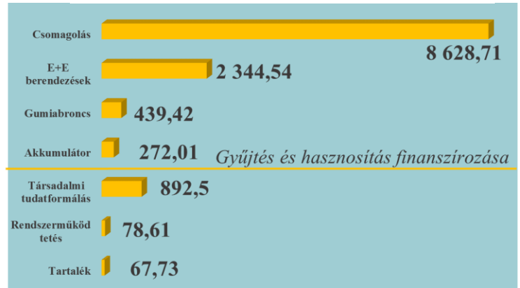
2. ábra: Nemzeti Hulladékgazdálkodási Igazgatóság költségvetése, 2016 (millió Ft)