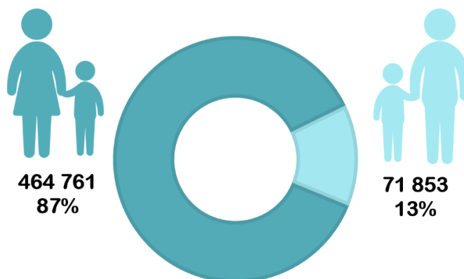
2. ábra: Egyszülős családok száma és aránya 2011

2015-ben a családi pótlékben részesülő családok 27 százaléka volt egyszülős, arányuk megegyezik a kétszülős, kétgyermekes családok arányával ( KSH 2016 ). A 2016-os mikrocenzus szerint a családok száma 2016-ban 2 millió 743 ezer volt, többségében párkapcsolatban élő családok gyermekkel vagy gyermek nélkül. A családok 18 százaléka pedig egy szülőből és egy vagy több gyermekből állt, ami mérséklődést jelent az egyszülős családok arányában ( KSH 2017a ).