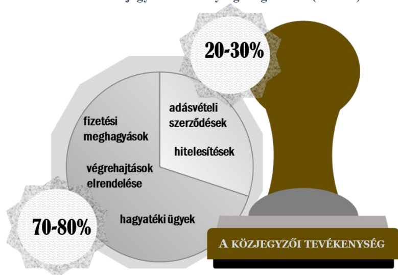
1. ábra: A közjegyzői tevékenység megoszlása (becslés)

Eljárása során csak a törvénynek van alávetve, és nem utasítható, tevékenységéért jogszabályban meghatározott díj és költségterítés illeti meg.