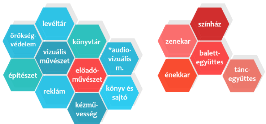
Kultúra tíz területe ESSnet-culture, 2012